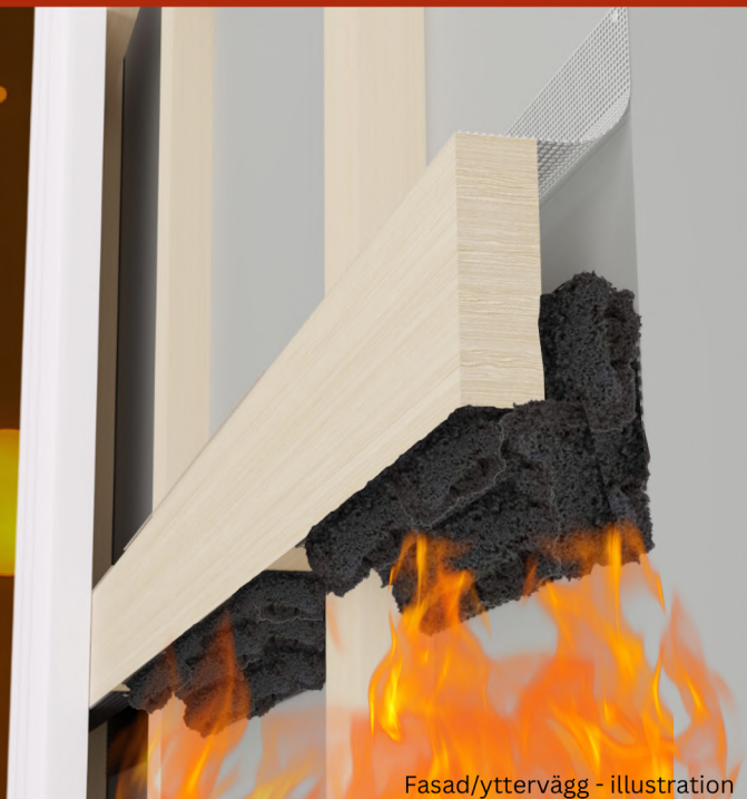
Fasad/yttervägg - illustration