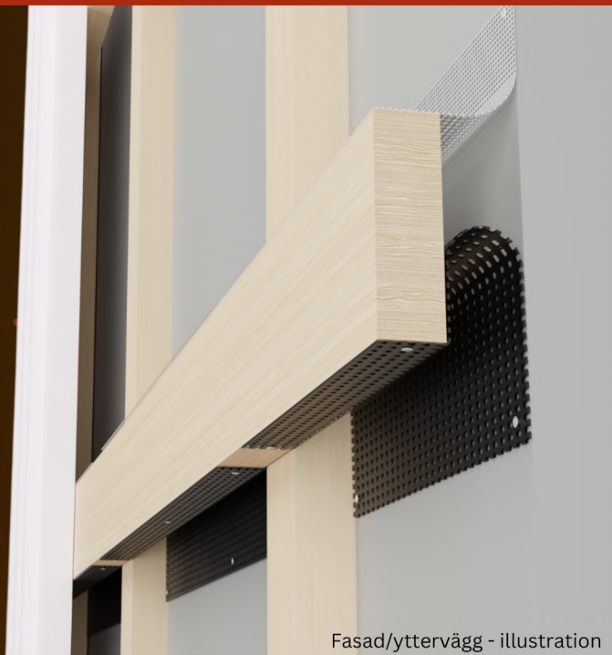
Fasad/yttervägg - illustration

INCA WFS net ® är framtaget för användning i luftspalter mellan 25-45 mm bakom fasadbeklädnaden, i höjd med syllen, i nivå med bjälklaget, samt i den ventilerade takfoten. Systemet säkerställer luftspaltens nödvändiga ventilation. Enkel att montera – bäst byggekonomi!